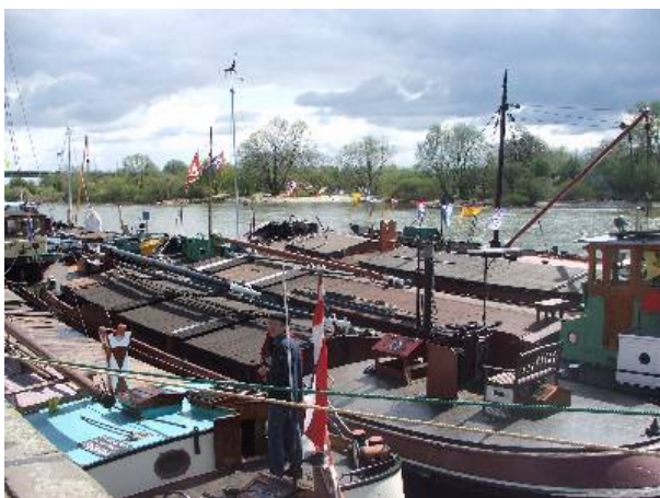
Impressie kadedag 2007

De overige punten zijn hetzelfde gebleven. Zodra we de laatste punten hebben uitgewerkt ontvangt iedere schipper het aangepaste reglement.