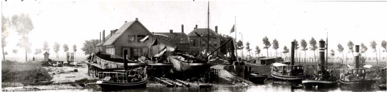
De voormalige Arnhemse Stoomsleephelling Maatschappij in de beginjaren.

Na een evaluatie van de 1 e Arnhemse Kadedag op 7 april j.l (niet te verwarren met de 1 e Arnhemse